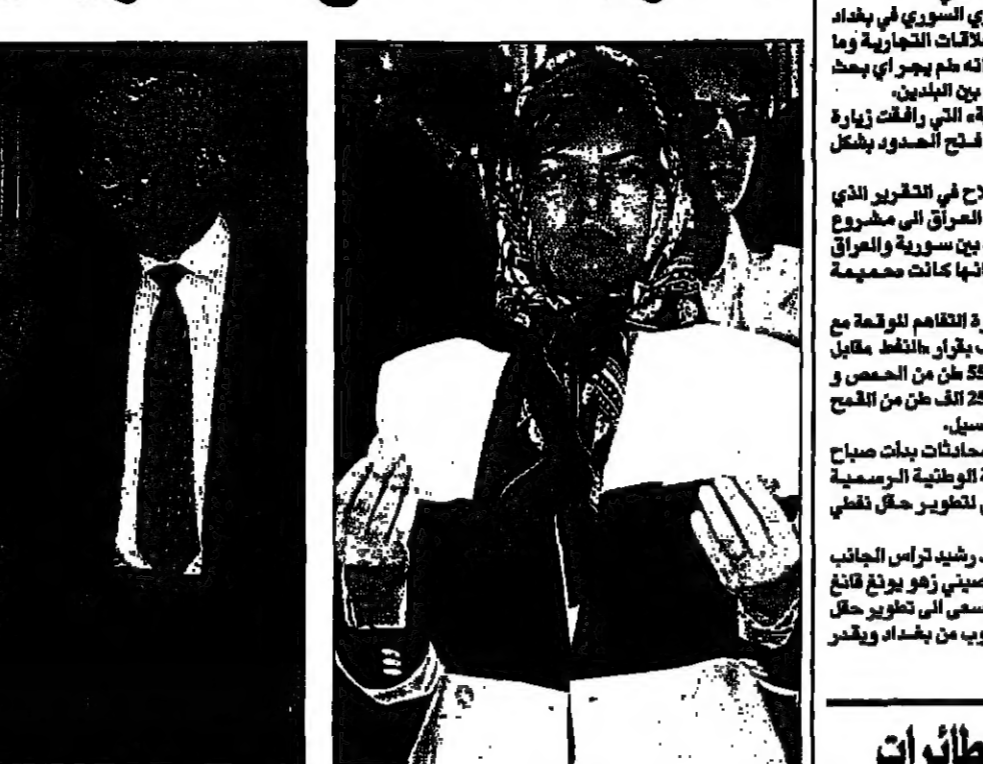
شيار نورا الغاشمة على ارواح الشهداء في انقرة. والي اليسار وزير الخارجية الاسرائيلي يستقبل نائبا من حزب الفرقة الاسلامي امس